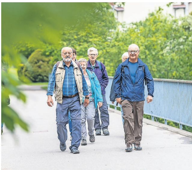
Die Wandergruppe kurz vor dem Ziel.