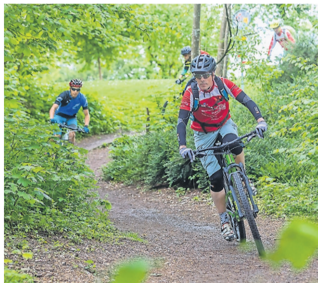
Mountainbikespass in der Region.